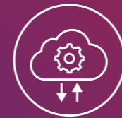
Tableau de bord de gestion

ClickShare a été la première technologie de collaboration sans fil à obtenir la certification ISO 27001, démontrant ainsi notre engagement à nous conformer aux processus et structures en lien avec les normes de sécurité internationale les plus élevées.